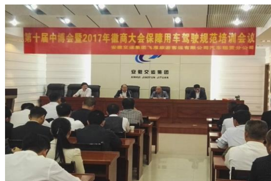
组织保障车辆驾驶员业务培训

训，对保障车辆进行安全检查。会见宴请组事先明确会议、用餐形式和标准，认真安排场地布置、路线引导、音响设备、菜品用品准备等事宜。局工作组和有关单位各司其职，整体联动，形成了强大合力，体现了省会水平。