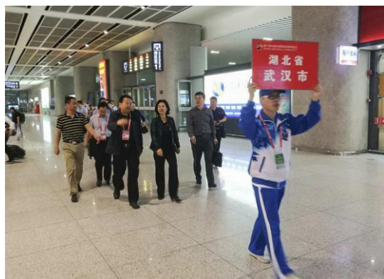
市委领导陪同来宾走出车站

会务用车 600 余台次，安排合肥“资本+创新”对接峰会等活动的会见宴请 10 批次约 260 人次。局全体保障人员以饱满的热情、精心的组织、高效的行动、周到的服务圆满完成了大会赋予的保障任务。