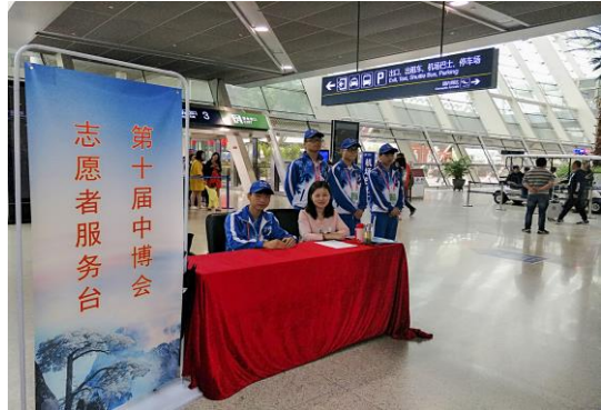
机场摆设志愿者服务台

四是顾全大局，体现了思想境界。我局把本次大会的接待任务当作政治任务来抓，坚决服从省、市工作大局。工作人员积极参与、相互支持，体现了我局文明和谐的精神风貌；紧张有序、日夜奋战，展现出特别能战斗、特别能吃苦