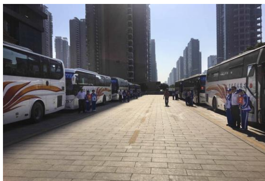
大会保障车辆整齐有序等候

三是高效组织，体现了务实作风。 按照市筹备工作领导小组的统一部署，我局研究制定了具体实施方案，明确了责任分工，完善了工作细节，做好了应急预案，协调对口接待