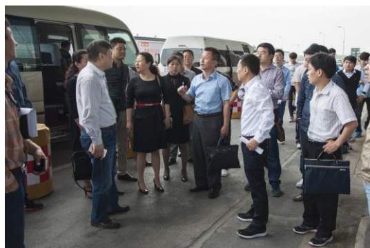
组织对口接待单位实地勘察路线

车站、高铁南站三个驻点迎送工作组。无论是保障方案的策划，还是迎送活动的组织；无论是大会车辆的调度，还是会见宴请的承办，都贯彻大会宗旨，凸显合肥城市精神，凝聚众人智慧，以热情周到的服务，展示了合肥良好形象。