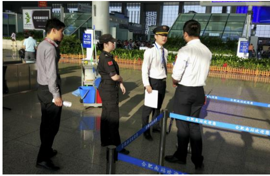
协调车站开辟绿色通道

车辆进出停放、人员接送通道等都预先进行了布置安排，来宾一踏上合肥的土地就感受到合肥的热情。车辆保障组督促各汽车租赁公司和车队对驾驶员进行用车规范、行车安全培